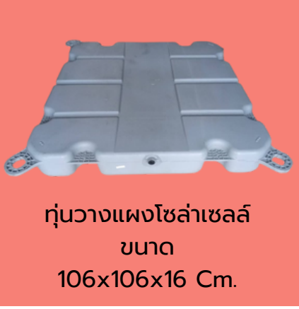
กุ่มวางแผงโซล่าเซลล์ ขนาด 106x106x16 Cm.