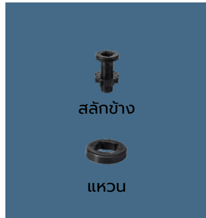
สลักข้าง