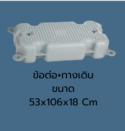
ข้อต่อ+ทางเดิน ขนาด 53x106x18 Cm